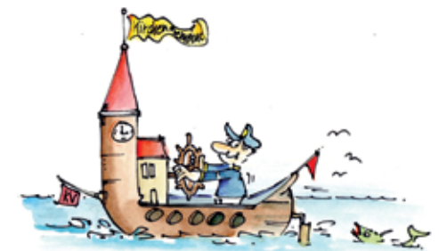
Zeichnung: Wolfgang Steinmeyer, s. S. 5 u. 36

Und dann sind da noch übergeordnete Einflüsse wie Wertewandel, Zuwanderung als Chance, neue politische Konstellationen und